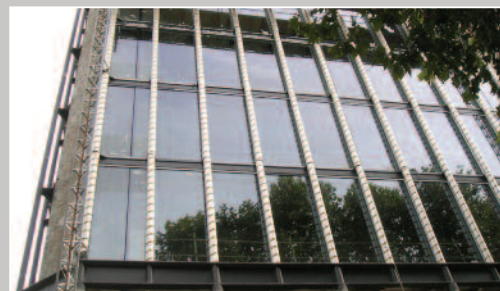
Protection des ouvrages terminés avant le montage de la façade.

Pour plus d'informations sur ce projet ou sur nos autres projets contacter le +33 (0) 1.34.68.89.44 ou info@sharpfibre.fr